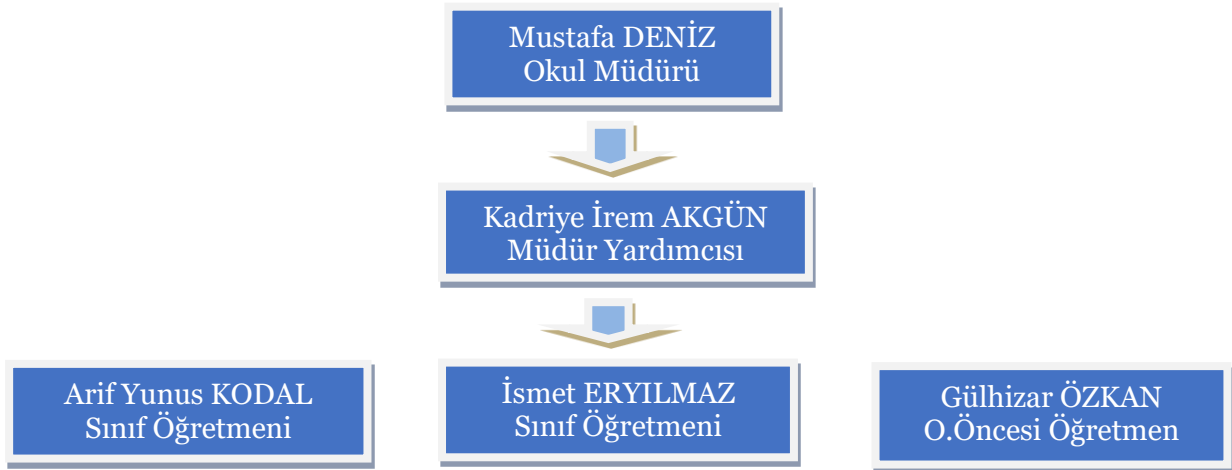
Tablo:9 Teşkilat Şeması