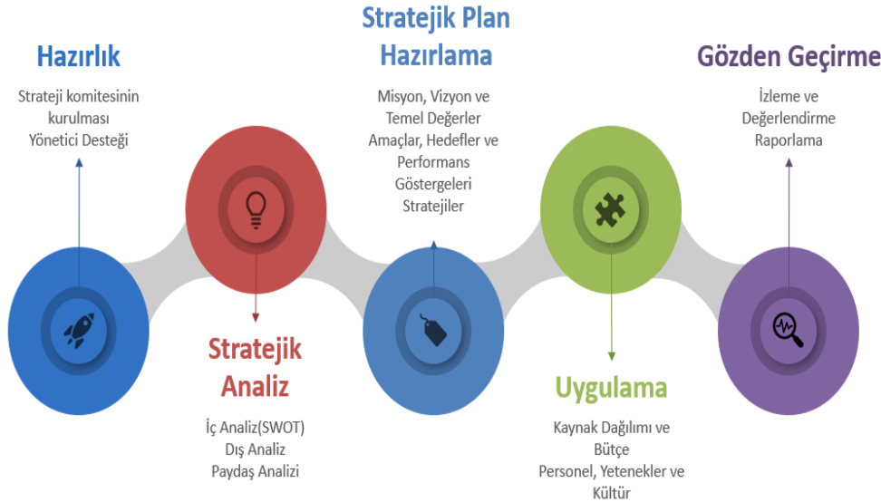
Tablo 2 Stratejik Planlama Döngüsü

Durum analizinin ardından geleceğe yönelim bölümüne geçilerek okulumuzun amaç, hedef, gösterge ve eylemleri belirlenmiştir.